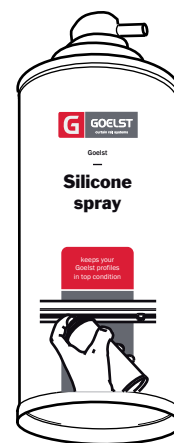
Goelst Silicone Spray

Om de 50 cm ca. 10 cm rail inspraken, met speciale spuitkop